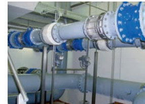
Rohrinstallation im Bedienhaus