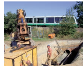
Durchpressung der Bahnlinie für die Entleerungsleitung des Hochbehälters