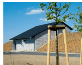
Bedienhaus des Hochbehälters Planitz

Mit einem Speichervolumen von 10.000 m 3 Inhalt leistet der Hochbehälter Planitz einen wesentlichen Beitrag für eine stabile, zuverlässige Versorgung unserer Region mit qualitativ hochwertigem Trinkwasser.